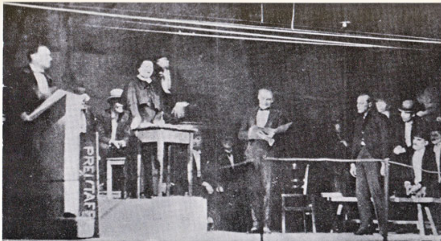
-Μαχαγκόνου- Παγκόσμια πρεμιέρα από Μπόντιν-Μπόντιν (1927)