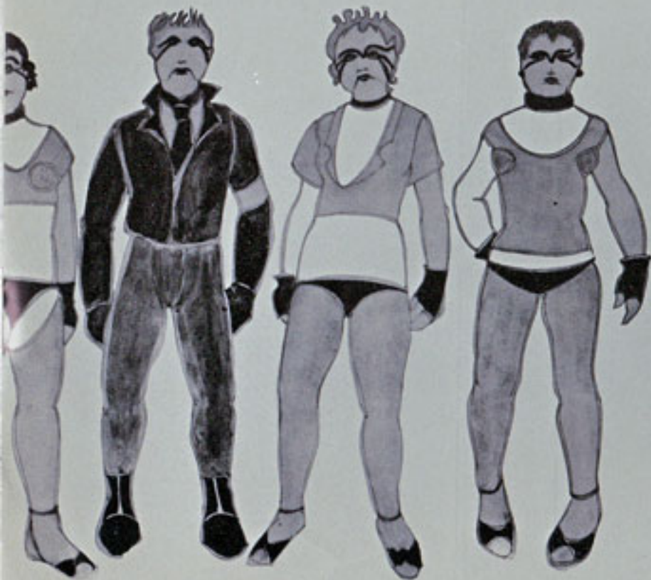
Μακέτες της Ι. Παπαντωνίου